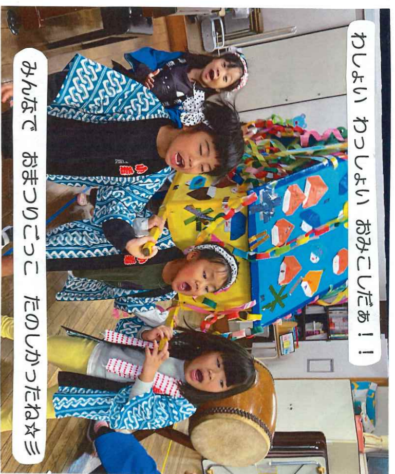
わしよい わつしよい おみこしたあ！！

※食材その他、献立内容を変更する場合があります。ご了承ください。よろしくお願ひいたします。